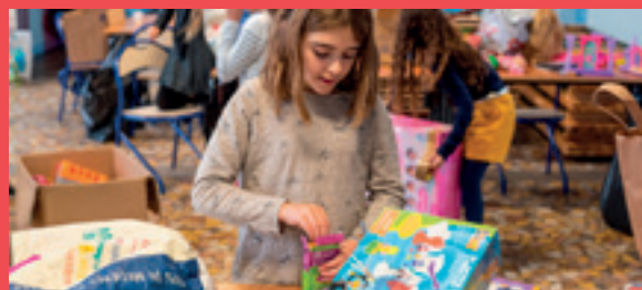
Le tri des jouets par le conseil des jeunes

La collecte de jouets du conseil des jeunes s'est achevée fin novembre. Début décembre, les jeunes élus, avec le renfort de seniors des espaces, trient les jouets récupérés. Direction ensuite les Restos du cœur, pour être distribués aux familles dans le besoin pour Noël.