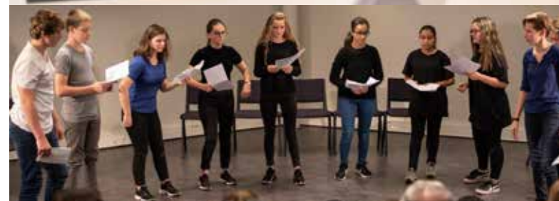
Récits de vie, à la médiathèque, menés par des collégiens et lycéens quevillais