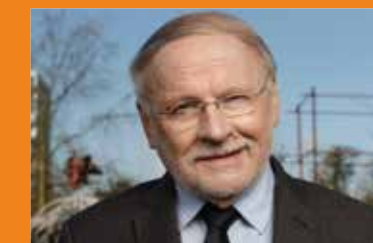
Marc Massion Maire

IDÉE 3 Organiser des moments de partage autour de la cuisine.