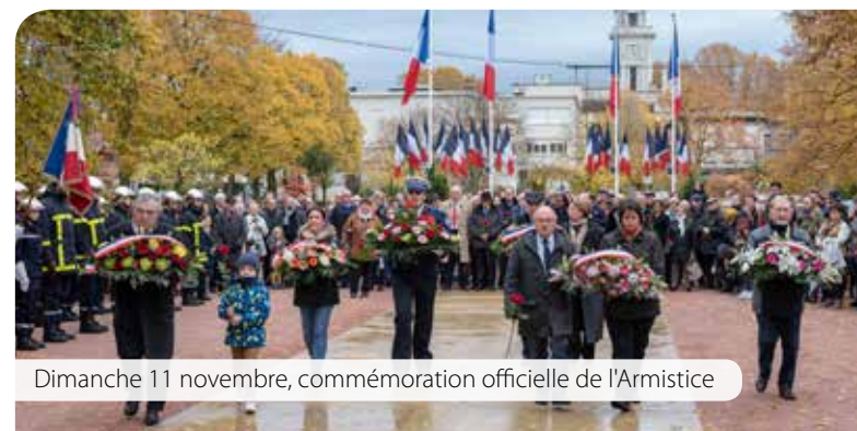
Dimanche 11 novembre, commémoration officielle de l'Armistice

Sans oublier la commémoration du traité de l'Elysée, symbole de l'amitié franco-allemande, qui s'est déroulée en mairie le jeudi 29 novembre. A cette occasion, des collégiens ont préparé des textes sur l'importance de l'amitié entre les peuples.