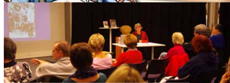
Projection-rencontre "Elles étaient en guerre" à la médiathèque