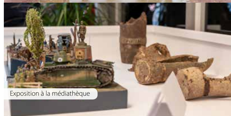
Exposition à la médiathèque