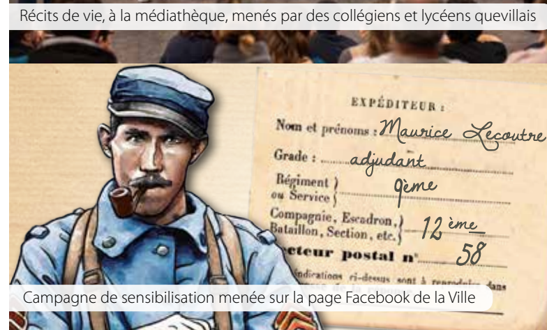
Campagne de sensibilisation menée sur la page Facebook de la Ville