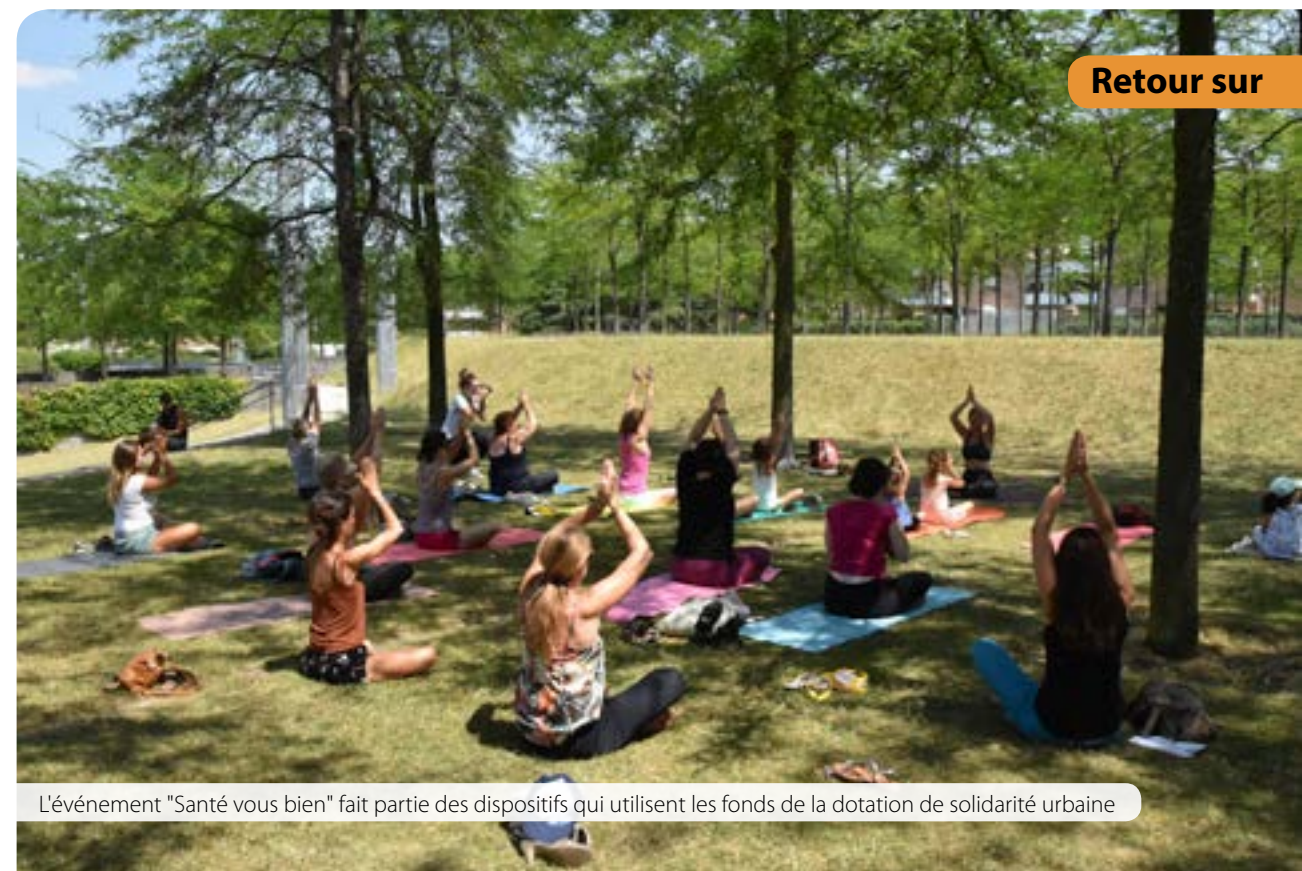
L'événement "Santé vous bien" fait partie des dispositifs qui utilisent les fonds de la dotation de solidarité urbaine

■ La Maison de santé Neil-Armstrong est un regroupement de professions libérales (médecins généralistes, dermatologue, sage-femme...) au sein d'un même bâtiment. C'est un cabinet médical comme les autres, mais en plus grand. Chacun est libre d'y consulter en prenant rendez-vous avec le médecin de son choix, comme dans n'importe quel autre cabinet. La maison de santé est située 8 rue Neil-Armstrong.