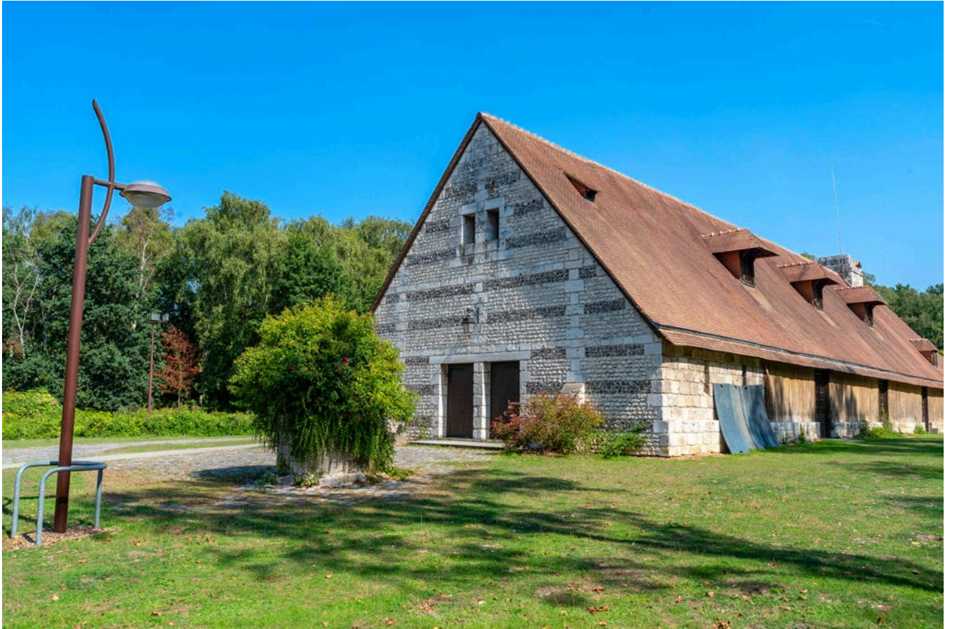
Grange du grand Aulnay