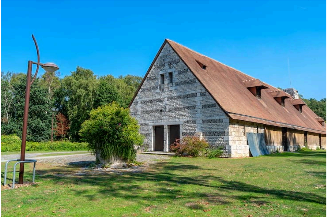
Grange du grand Aulnay